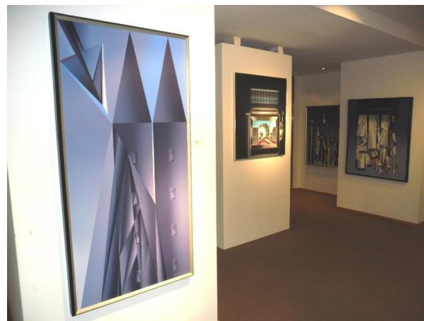
Zwillingstürme im Vordergrund

Mit seiner Intention zu Phänomenen und Themen in der heutigen Zeit wie Bedrohung und Gewalt, Verletzung und Zerstörung, die der Mensch sich selbst, der Natur und der Umwelt antut, setzt er seine Zeichen. Oertel selbst sagt: "Reiner Realismus ist ein schlechter Botschafter". Mit seinen Bildideen setzt er neue Akzente die mit diesem Genre der "Anklage" in eine neue Richtung gehen. Asse, Gorleben, die Zerstörung der Twin Towers in New York sind die großen Hauptthemen in dieser Ausstellung. In den Alarmfarben Feuerrot und Giftgrün setzt der Künstler die eingelagerten radioaktiven Fässer in einer Entsorgungsdeponie in Szene.