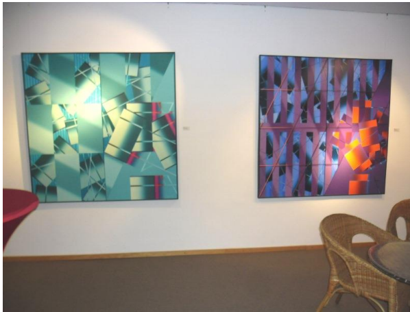
In den Netzen I + II

Mit feinem Strich und seinen geometrisch angelegten Formen gibt er seinen Werken Inhalte, die nur vordergründig ästhetisch wirken, dabei aber, nach genauerem Hinsehen, den Betrachter erstarren lassen. Selbst die zum Teil farbenfroh abgestimmten Rauten, Kuben, Recht- und Dreiecke können nicht darüber hinweg täuschen, dass es der Künstler mit seiner Aussage ernst meint. Mit der Präzision eines Zahnmediziners lässt er seine "Behandlungsgeräte" bei einem violetten Hintergrund eher als Folterinstrumente wirken, sodass es einem einen eiskalten Schauer über den Rücken laufen kann und der nächste Zahnarztbesuch leicht zu einem Horrortrip werden könnte.