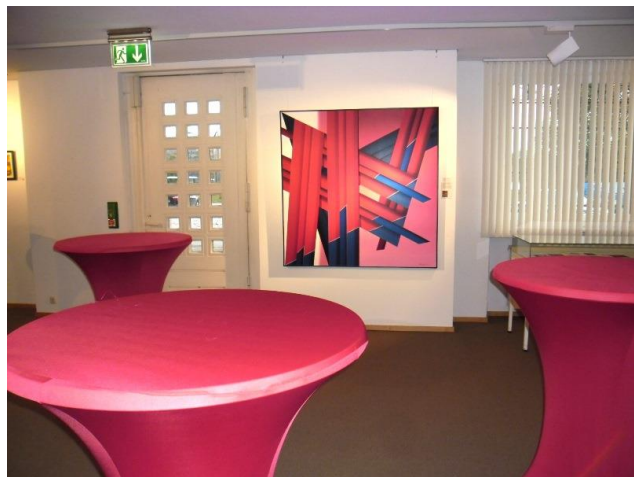
Aufstand der Leitplanken

Diese Sonderausstellung, die noch bis zum 24.01.2018 in den Räumen der "Bürgergalerie" der Förde Sparkasse am Lorentzendamm zu besichtigen ist, ist ein Dankeschön an einen Maler, der seit 60 Jahren mit seinen Bildern Aufsehen erregt.