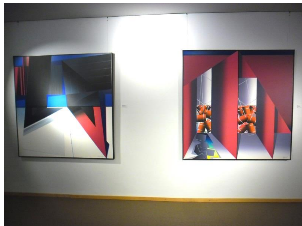
Gebrochene Brücke + ASSE-Deponie