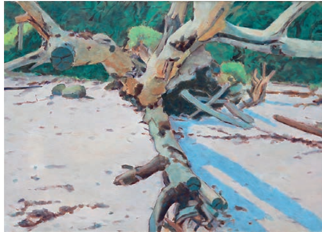
Holnis, 1994, Öl, 50 x 70

Flensburger Dampf Rundum, 1997 Aquarell, 30 x 41 (Ausschnitt)